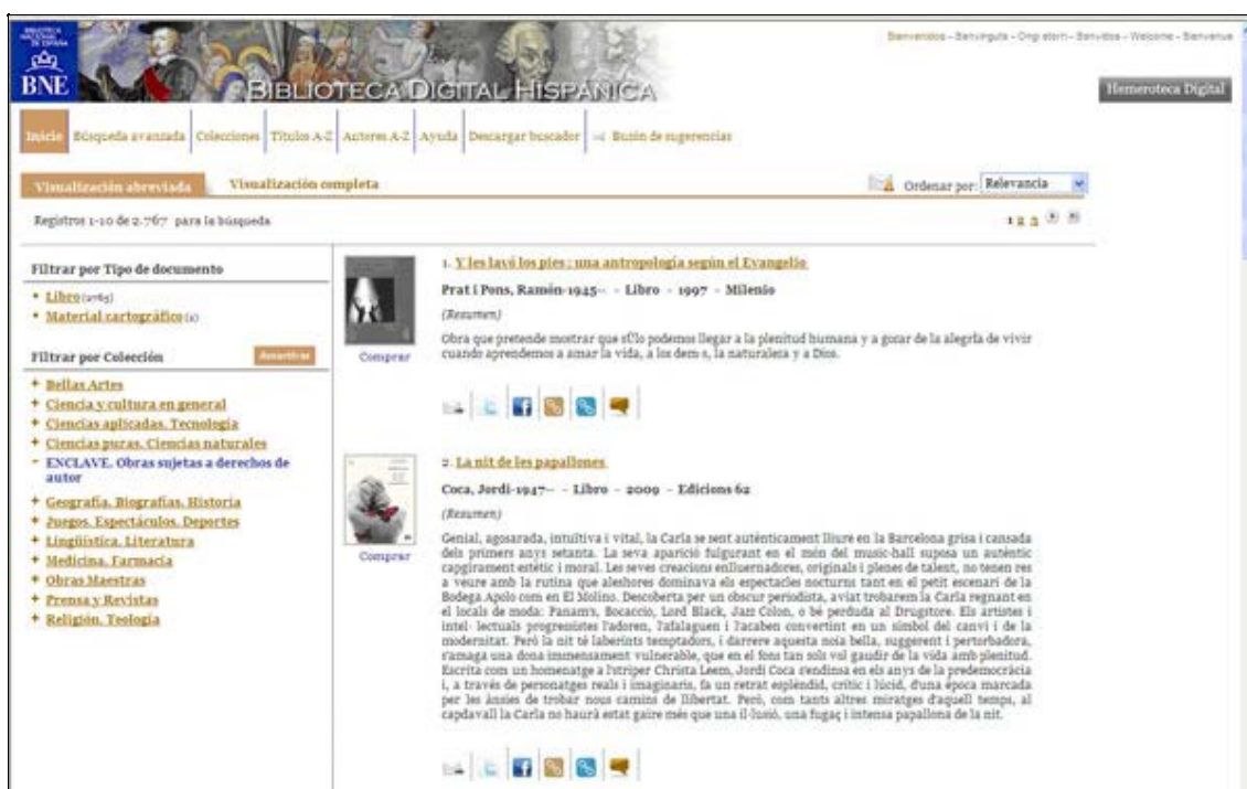
Figura 3. Visualización de obras pertenecientes a ENCLAVE

Los resultados pueden incluir obras en dominio público así como obras sujetas a derechos de autor. Ambos tipos de obra se diferenciarán en los listados de las fichas correspondientes mediante el icono de compra que figura al pie de la miniatura del registro bibliográfico. Al hacer click sobre este icono de compra se accederá la página del e-distribuidor.