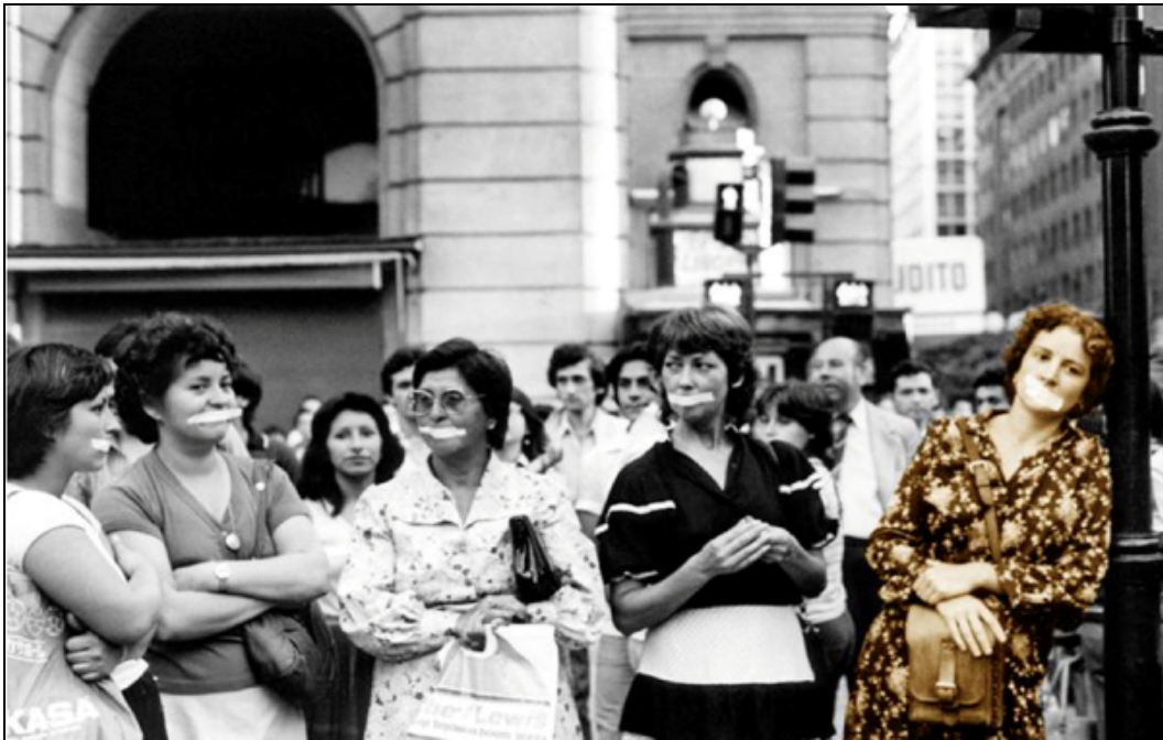
Imagen 1. Intervención callejera, centro de Santiago.

de redes horizontales, en los que se convocaba a miles de mujeres a actividades públicas y que articulaban el movimiento de mujeres en Chile con sus pares de todo el mundo. Pero su repertorio de acción no se limitó al recurso —históricamente masculino— de la palabra. Las acciones más creativas, osadas y disruptivas recurrieron al propio cuerpo, a la calle e incluso al estadio de fútbol, que se significaron como espacios de intervención política y de interlocución con la sociedad chilena, que parecía no querer involucrarse en la demanda por el fin de los crímenes. Mediante performances e intervenciones públicas relámpago, marchas y acciones de arte, miles de mujeres organizadas conminaron al régimen y a la sociedad (véase la imagen 1).